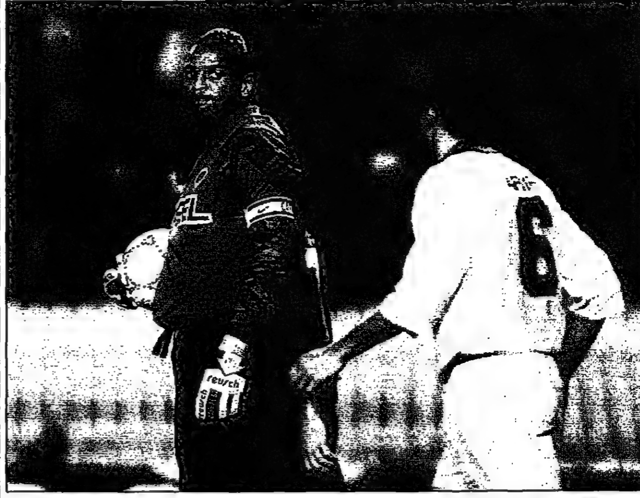
برنارد لاما كابتن فريق باريس سان جرمان وحارس مرماه إلى اليسار يبراهم مع الفريق حامل اللقب خطر قفلته

تخوض باريس سان جرمان الفرنسي حامل اللقب خطر الخروج من مسابقة كأس الكؤوس الأوروبية لكرة القدم عندما يلتقي أيك برانس في العاصمة الفرنسية اليوم الخميس في ذهاب الدور ربع النهائي.